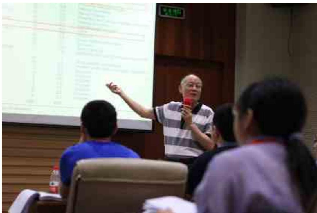
报告 4a 在组织行为/人力资源管理研究中的调查工具的开发 OB/HRM constructs (樊景立, Larry Jiing-Lih Farh)