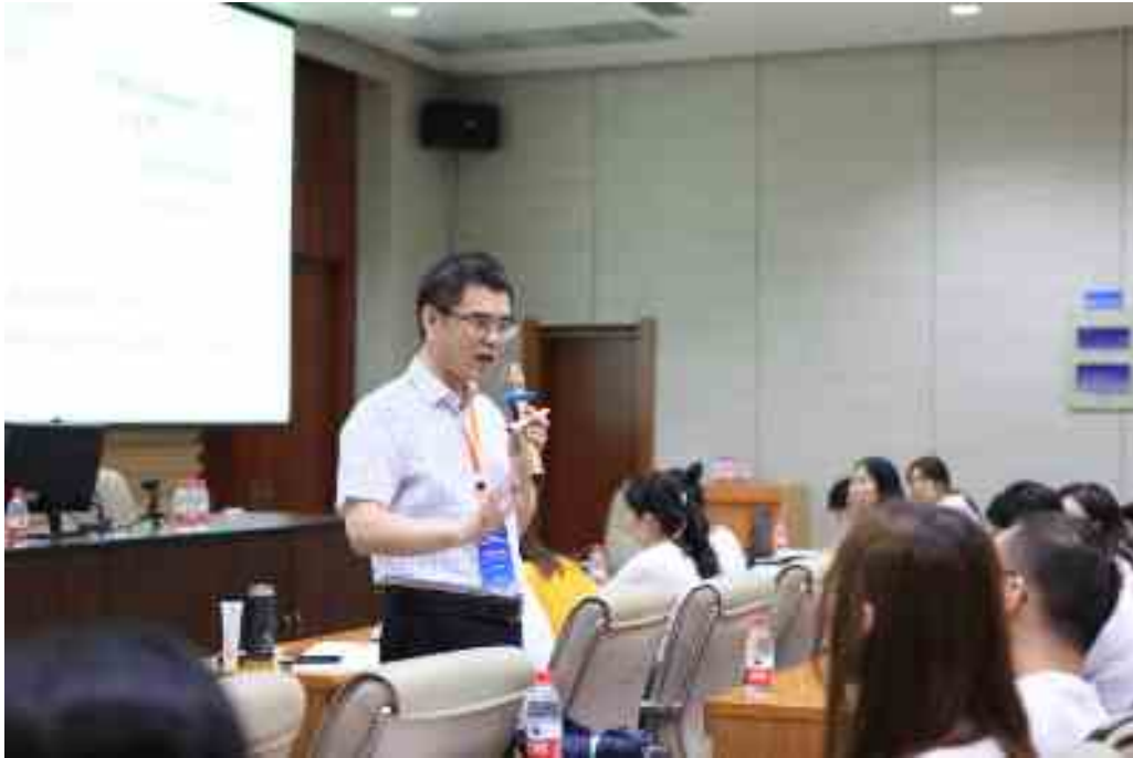
报告 7a 定性研究方法 (宏观) Qualitative research-Macro (井润田, Runtian Jing)