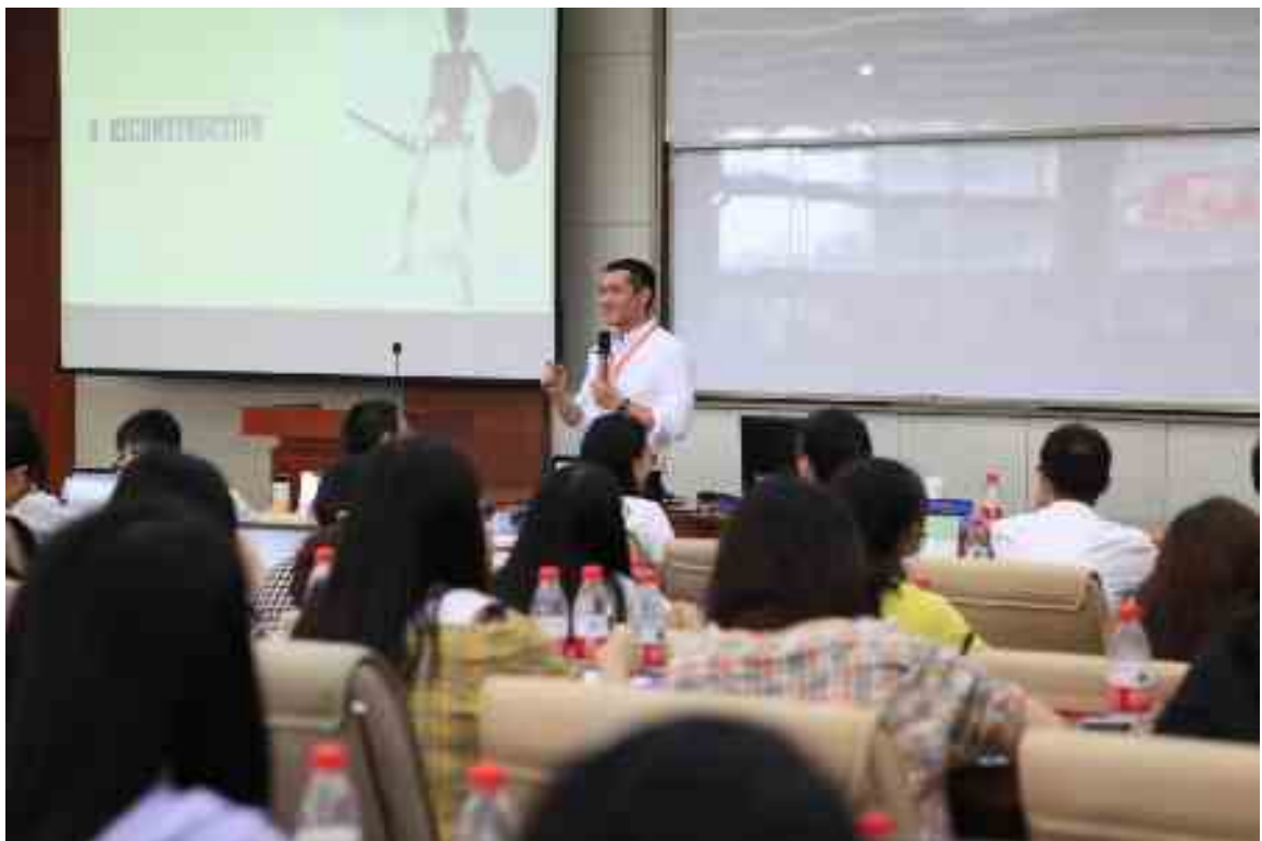
报告 6 调查研究 Survey Research (黄旭, Xu Huang)