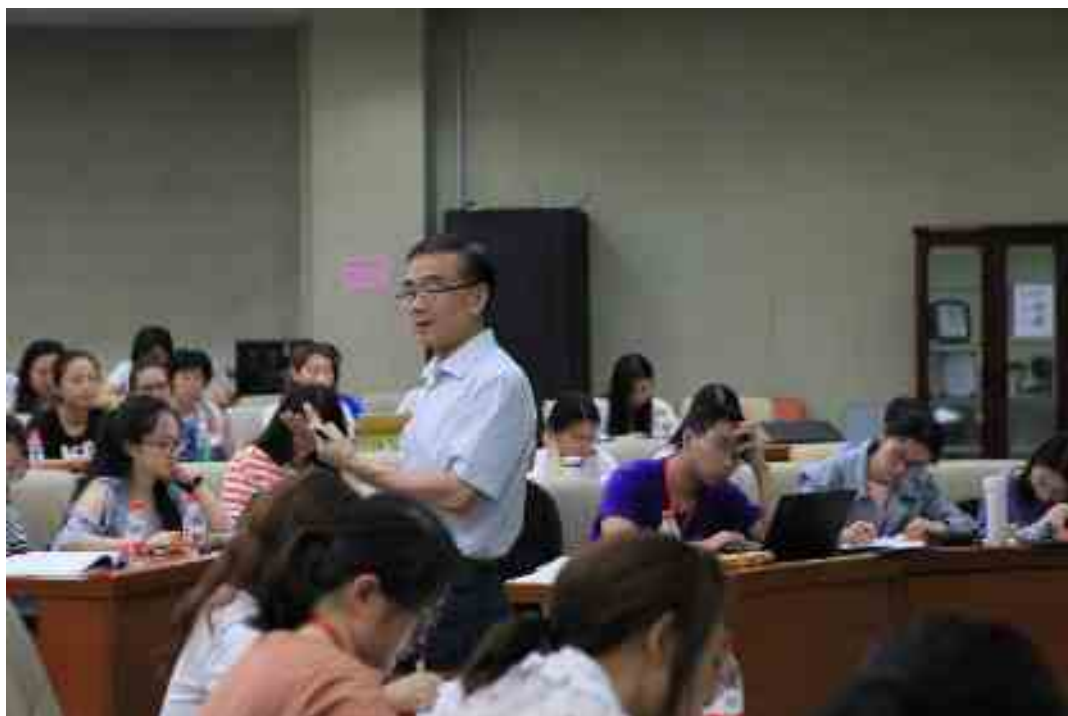
报告 7b 定性研究方法 (微观) Qualitative research-Micro (陈昭全, Chao Chen)