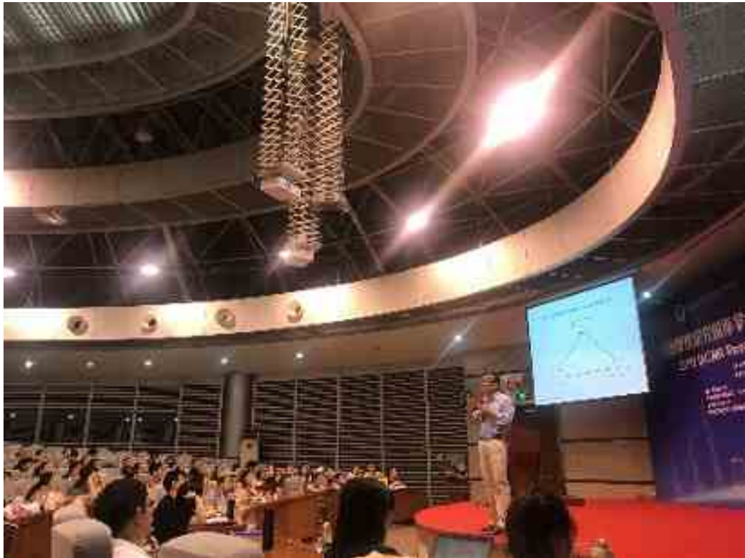
报告 3 构建理论和假设 Developing Theory and Hypotheses (陈昭全, Chao Chen)