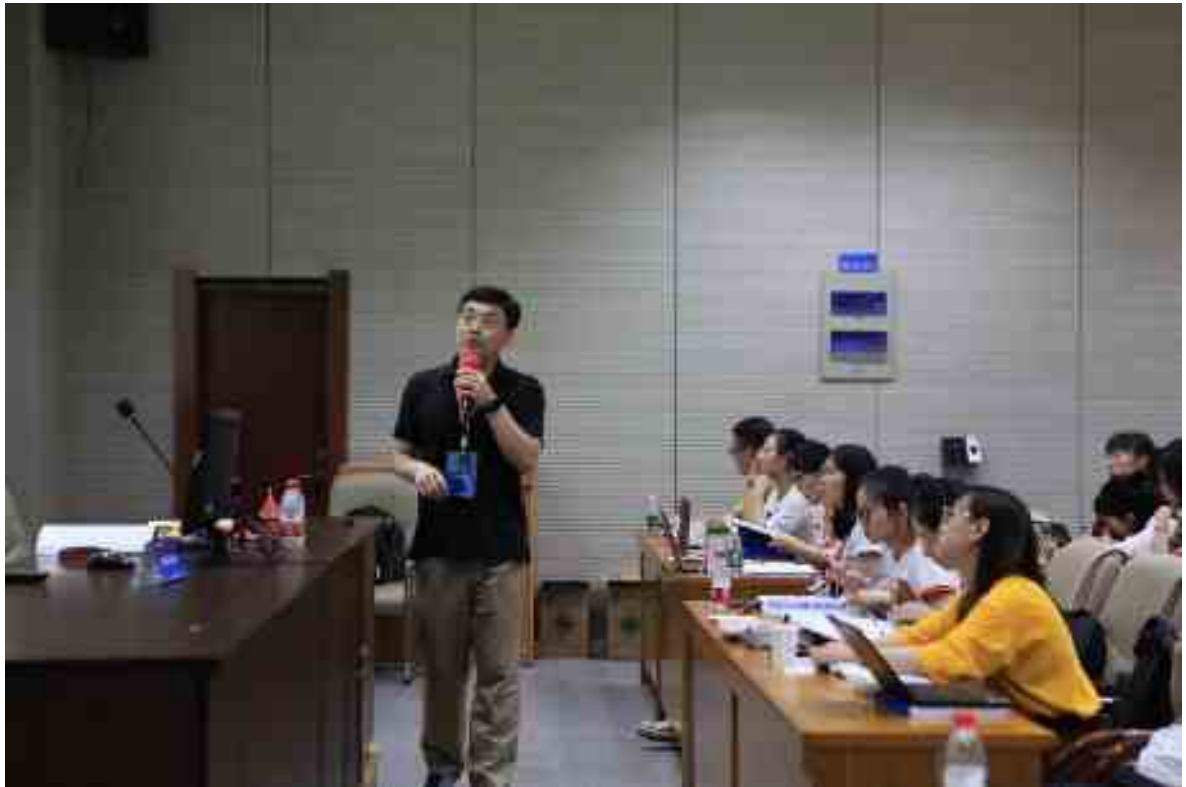
报告 8a 纵向研究 Longitudinal research (沈伟, Wei Shen)