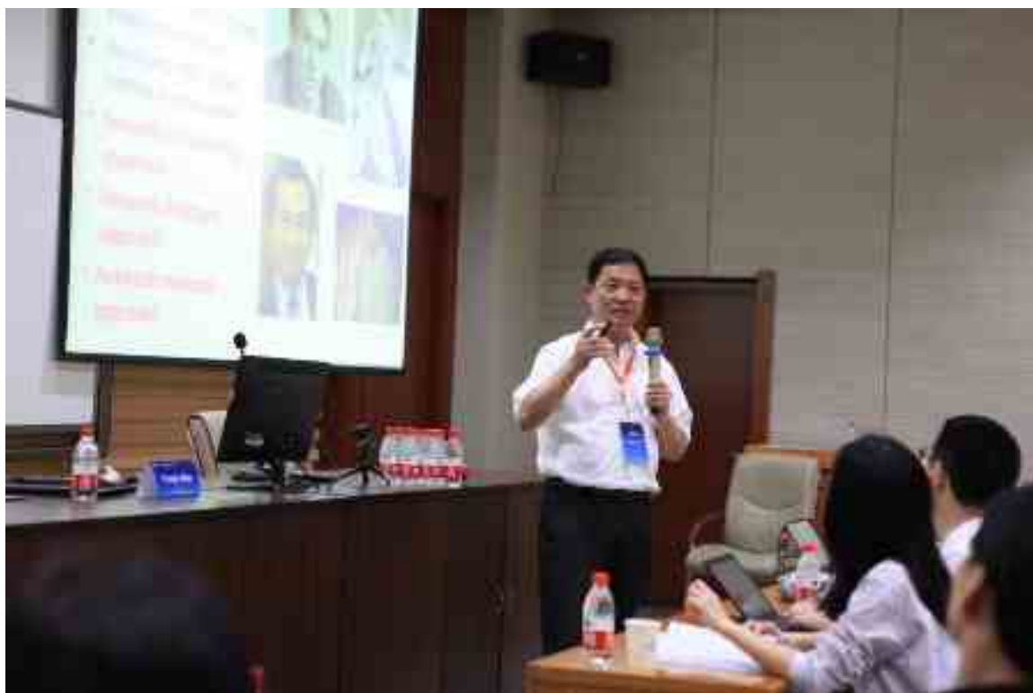
报告 9a 网络分析 Network Analysis- Macro (边燕杰, Yanjie Bian)