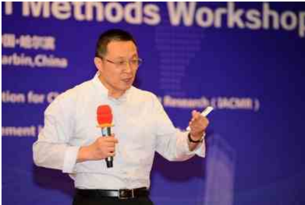
报告 1 科学研究过程及其方法 The Scientific Research Process and Types of Empirical Studies (张志学, Zhixue Zhang)