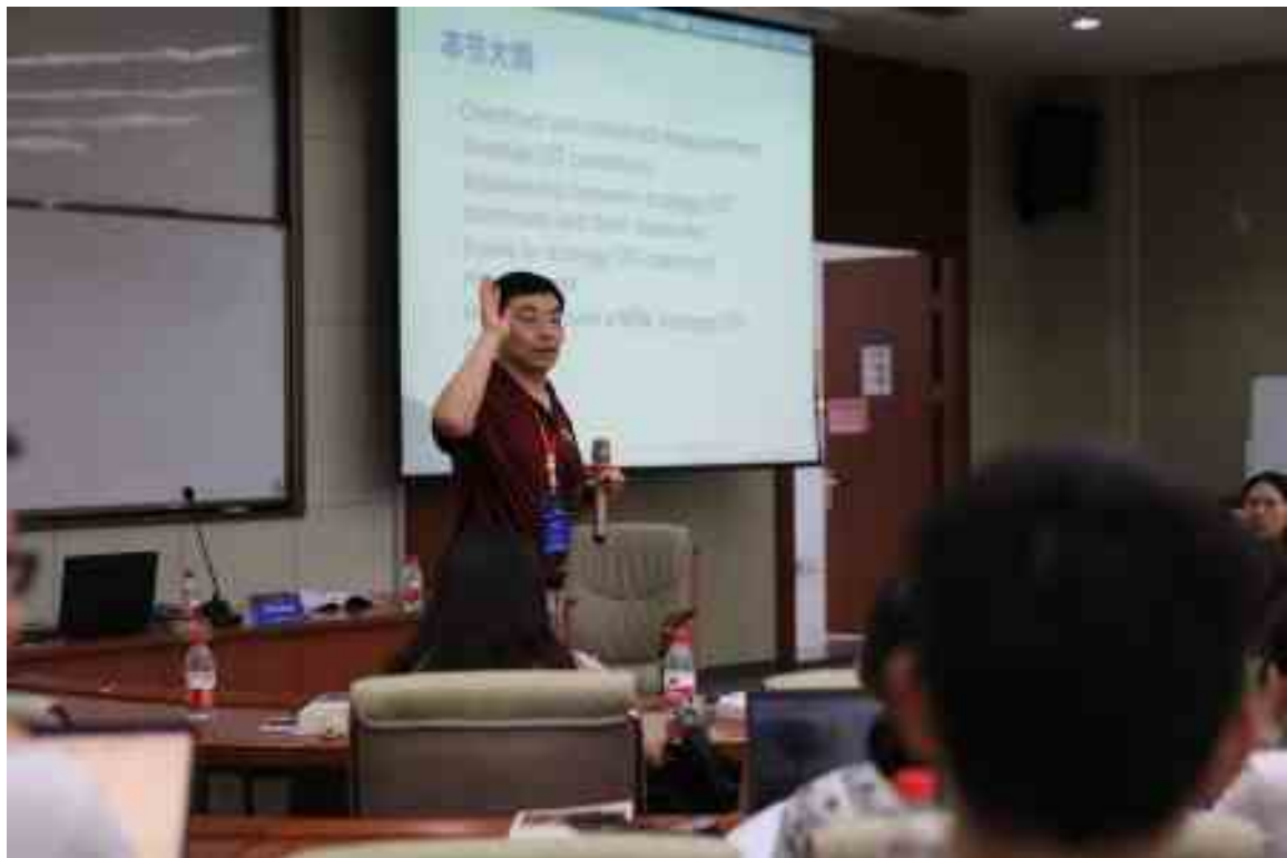
报告 4b 宏观构念的度量 Strategy/OT constructs (沈伟, Wei Shen)